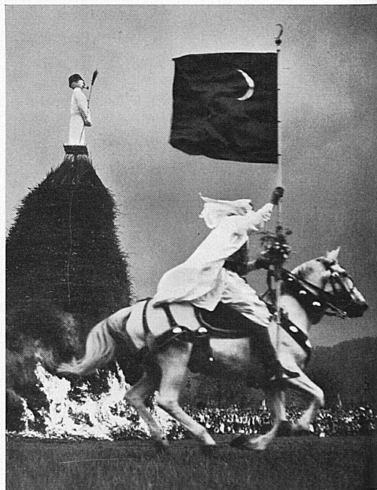
Am Sechseläuten, 17./18. April, verbrennen die Zürcher mit dem «Böögg» den Winter.

Lors du Sechseläuten, les 17/18 avril, les Zurichois brûlent le «Böögg», symbole de l'hiver.