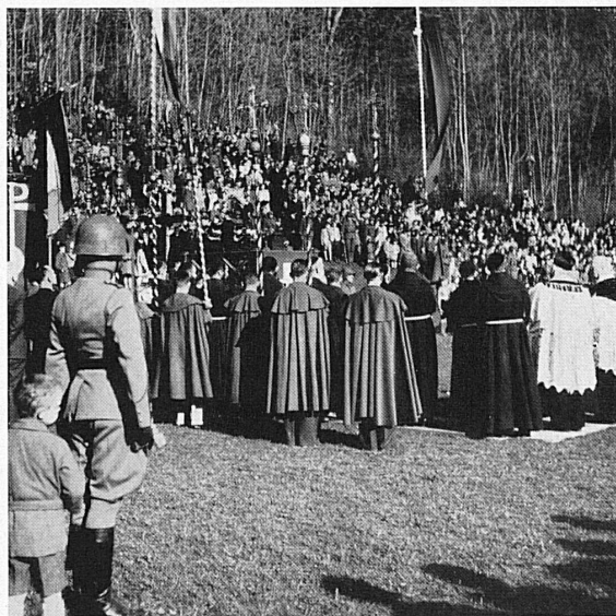
Die Erinnerung an die Schlacht von Näfels im Jahre 1588 wird alljährlich mit der Näfeler-Fahrt-Festlich begangen, dieses Jahr am 14. April.

La bataille de Näfels (1588) est commémorée chaque année par la fête de Näfels, fixée cette année au 14 avril.