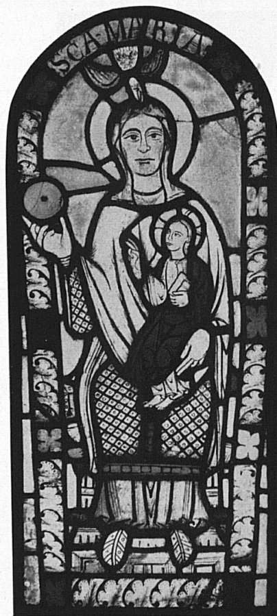
Vitrail de Marie de Flums, 12 e siècle

Hasler AG Bern WERKE FÜR TELEPHONIE UND PRÄZISIONSMECHANIK