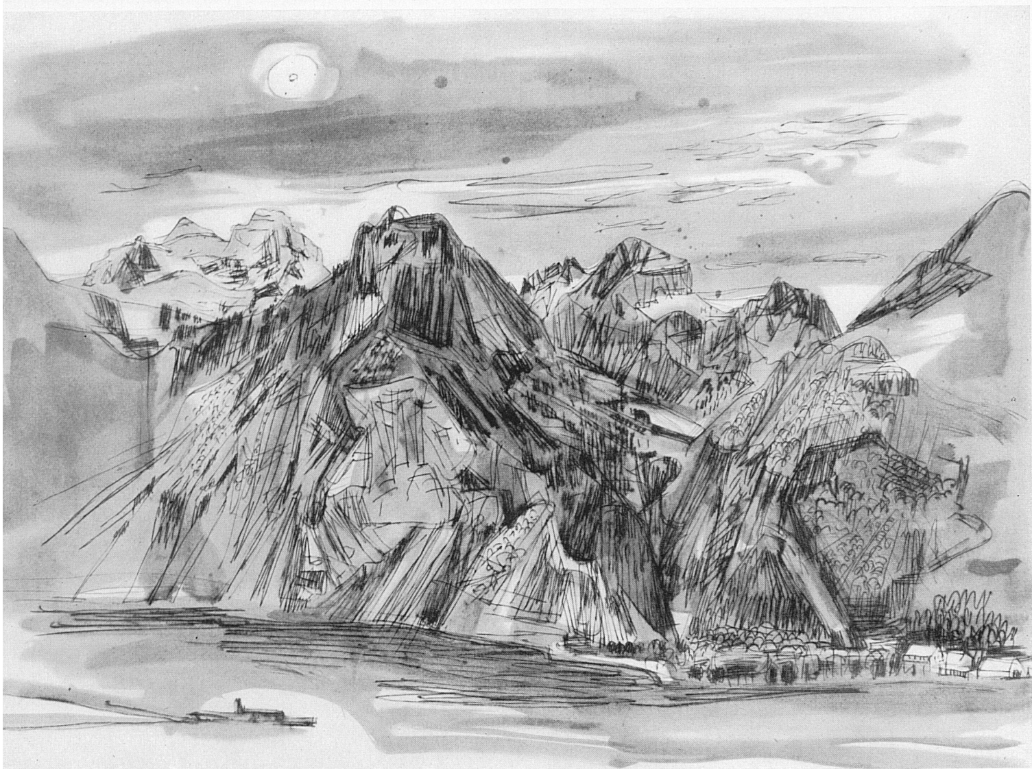
Der Vierwaldstättersee im Herbst. Zeichnung von Heinrich Danioth, 1896–1953; aus «Stille Welt», Verlag Ars Helvetica, Zürich. – Le lac des Quatre-Cantons en automne. Dessin d'Henri Danioth, 1896–1953.