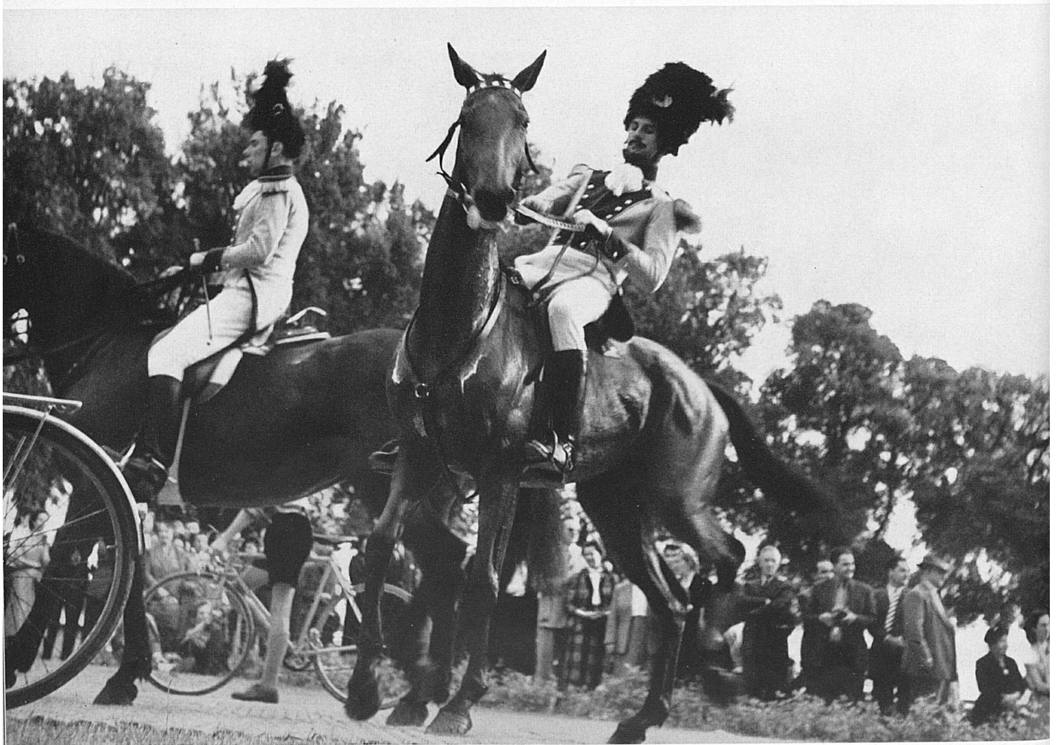
Ein Winzerfest in Neuenburg kann nie ein «Massenanlaß» werden. Dieses große schweizerische Herbstfest wahrt die Züge des Individuellen. Verspüren wir das nicht durch die nebenstehende Photographie aus den Gesichtern der Zuschauer beim Festzug?