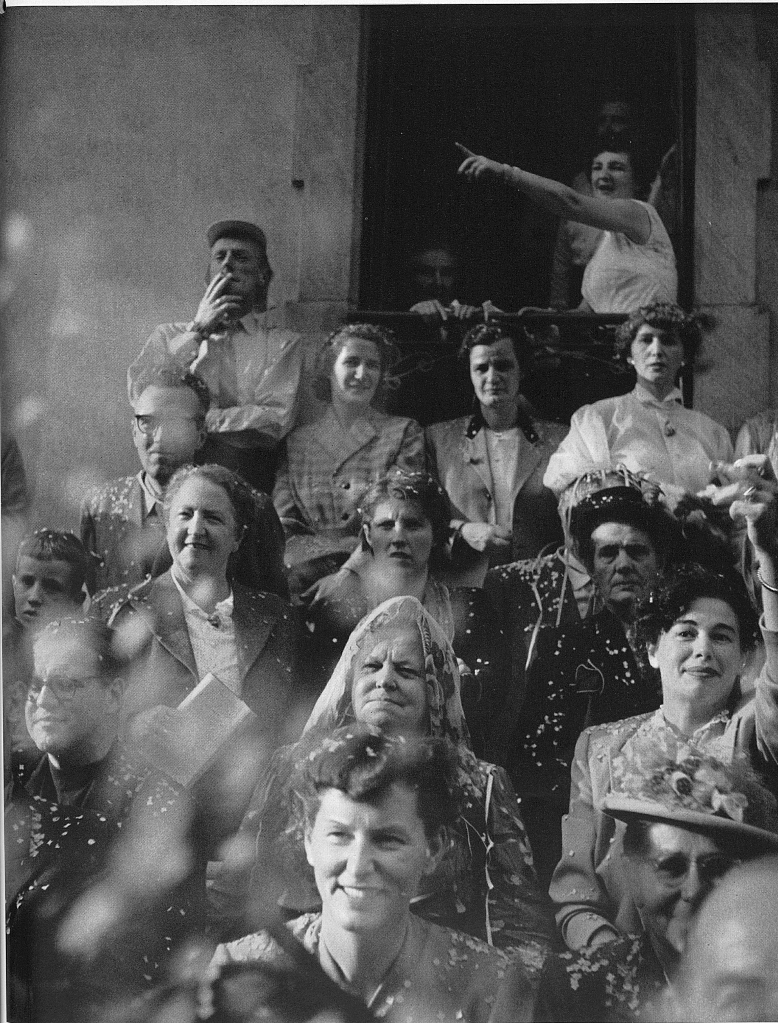
La prossima Festa della vendemmia a Neuchâtel avrà luogo il 2 e 3 ottobre. Ecco una manifestazione che conserva un suo tipico suggello individuale, come si può vedere dai volti degli spettatori che assistono al passaggio del corteo.