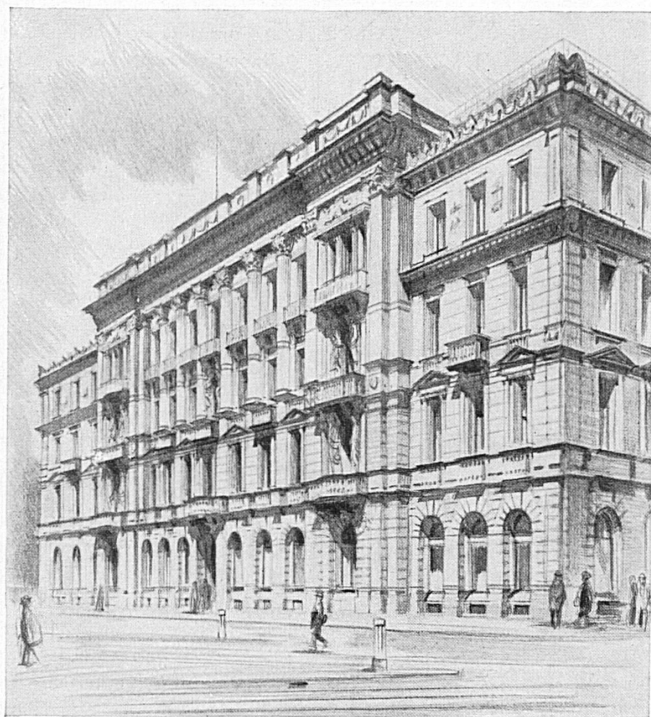
Hauptplatz in Zürich