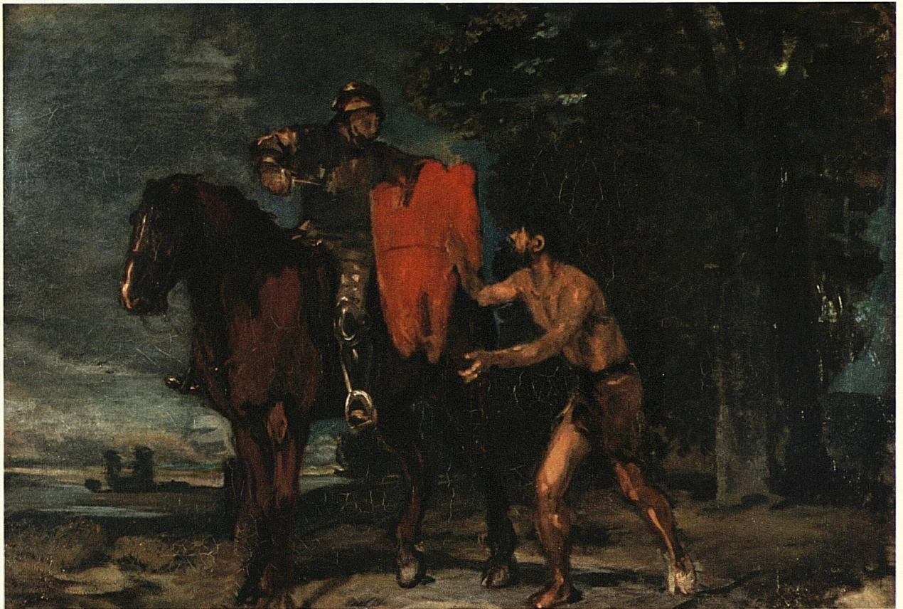
Hans von Marées, 1837–1887. Der heilige Martin und der Bettler, 1869 (Höhe 74 cm, Breite 105,5 cm). – Saint-Martin et le mendiant, 1869. – San Martino e il mendicante, 1869. – Saint Martin and the Beggar, 1869.