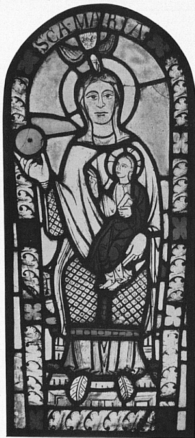
Vitrail de Marie de Flums, 12 e siècle

Geheiztes Schwimmbad, Tennis, Spiel- und Sportwiesen, Orchester Garage, Berühmte Wasserfälle Park-Hotel , Pension ab Fr. 17.—, Tel. (036) 4 15 12