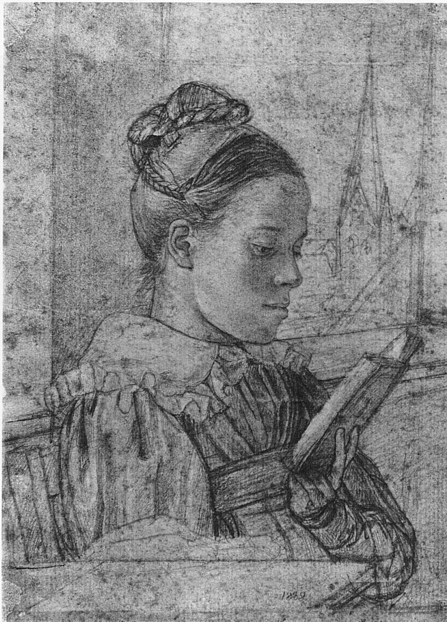
Rudolf Friedrich Wasmann, 1805–1886. Lesendes Mädchen, 1828. – Jeune fille lisant, 1828. – Ragazza che legge, 1828. – Girl reading, 1828.