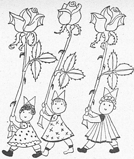
Vignetten von – Vignettes de Hans Fischer