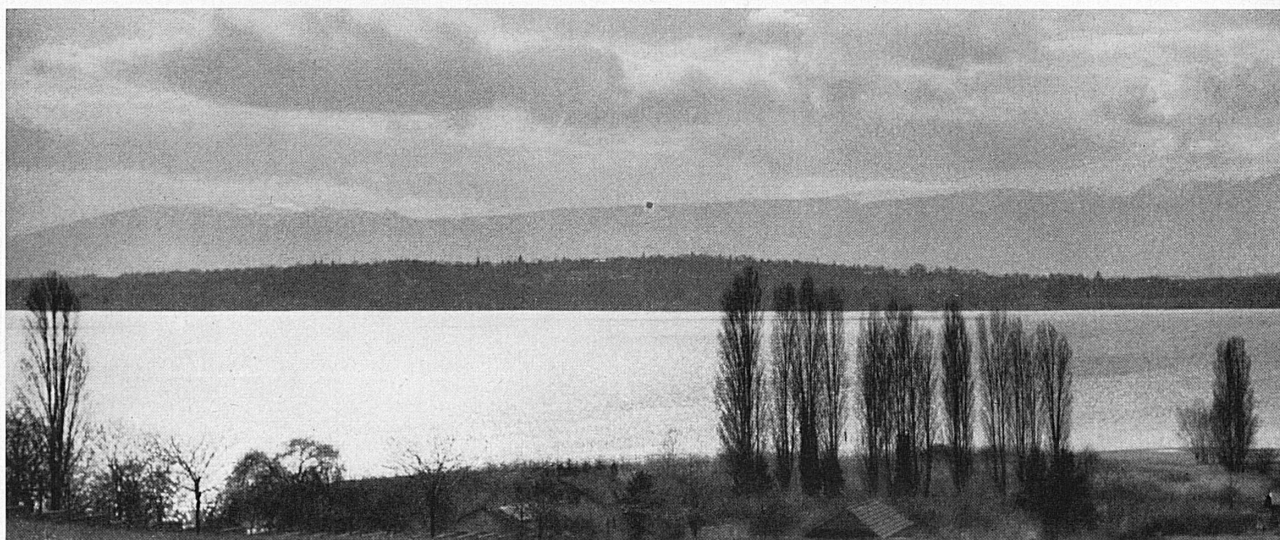
Ci-dessous: Instantanés pris lors du Rallye des neiges 1951. De gauche à droite: De nuit, en s'approvisionnant d'essence; l'arrivée à Genève.

Unten: Die Landschaft am untern Genfersee. Im Hintergrund die langgestreckte Kette des Jura.