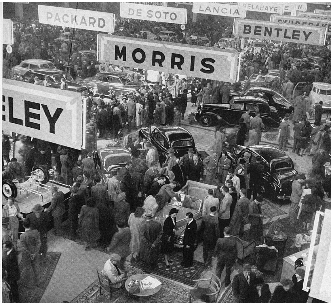
A gauche: Vue de la grande salle du Salon de l'auto à Genève.

Links: Blick in die große Halle des Genfer Auto-salons.