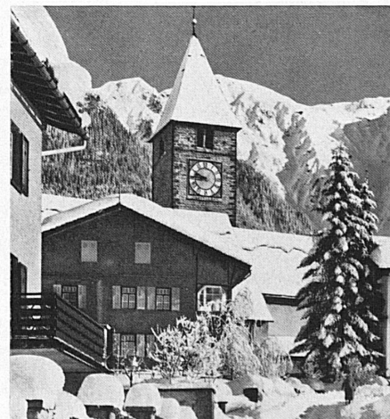
Oben: Im alten Klosters — Ci-dessous: Au vieux Klosters.