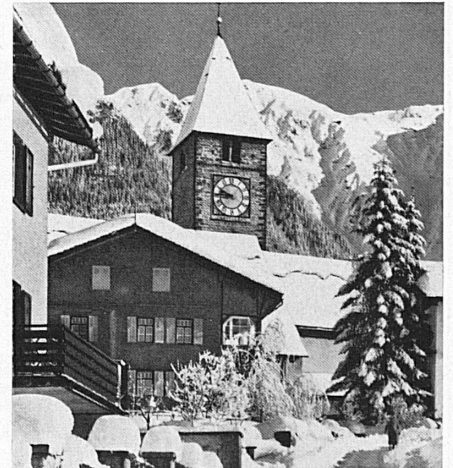
Oben: Im alten Klosters — Ci-dessous: Au vieux Klosters.