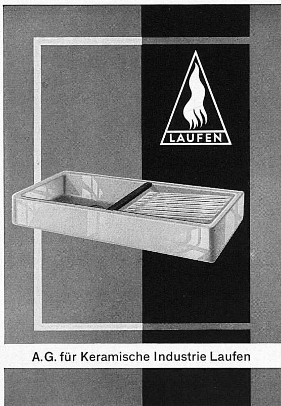
A.G. für Keramische Industrie Laufen

Hasler AG Bern WERKE FÜR TELEPHONIE UND PRÄZISIONSMECHANIK