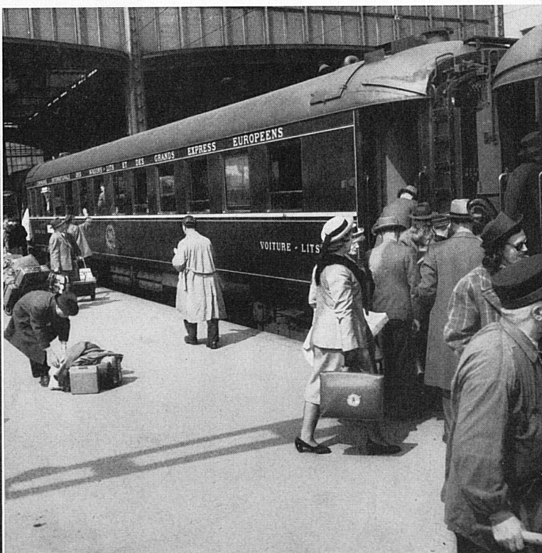
Ci-dessus: Wagon-lit, dans la gare internationale de Bâle CFF. Oben: Schlafwagen im internationalen Bahnhof Basel SBB.