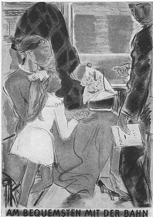
Das jüngste Plakat der SBB entwarf der Genfer Maler Maurice Barraud. – La plus récente affiche des CFF est signée du peintre genevois Maurice Barraud. – Il più recente cartellone pubblicitario delle FFS è opera del pittore ginevrino Maurice Barraud.

ÄNDERUNGEN VORBEHALTEN • CHANGEMENTS RÉSERVÉS