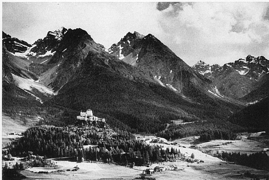
Oben: Blick über die Gegend von Scuol-Tarasp-Vulpera mit dem herrlich auf der Anhöhe thronenden Schloß Tarasp.

Ci-dessus: Vue sur la région de Scuol-Tarasp-Vulpera, avec le château de Tarasp trônant majestueusement sur les hauteurs.