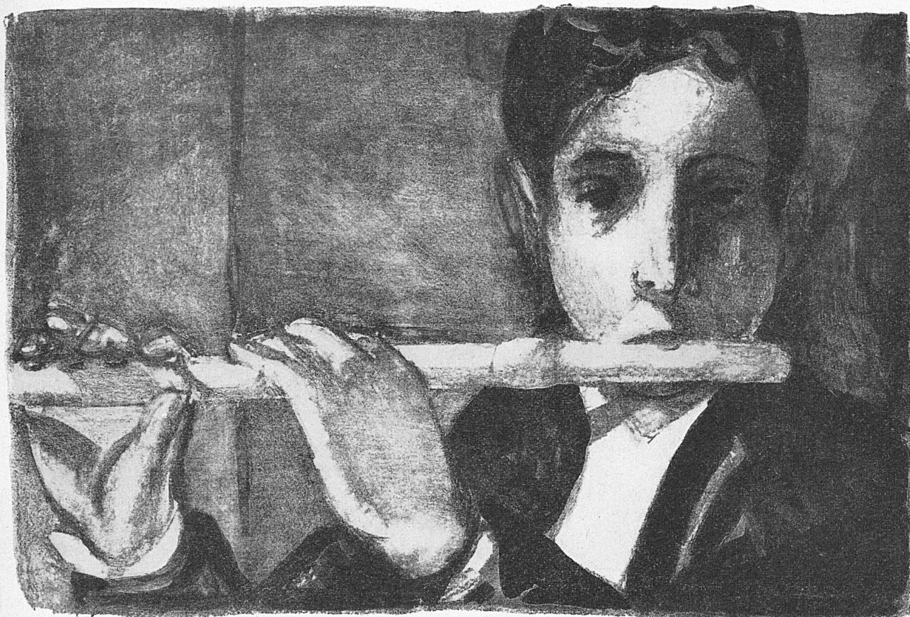
«Flötenspieler», von Max Truninger «Joueur de flûte», de Max Truninger Kunstblatt der «Art»