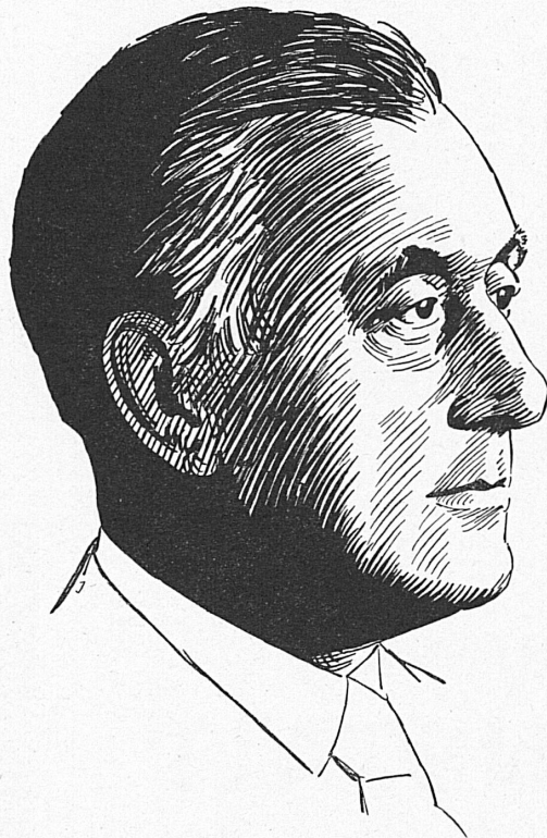
Zeichnung von E. Joller