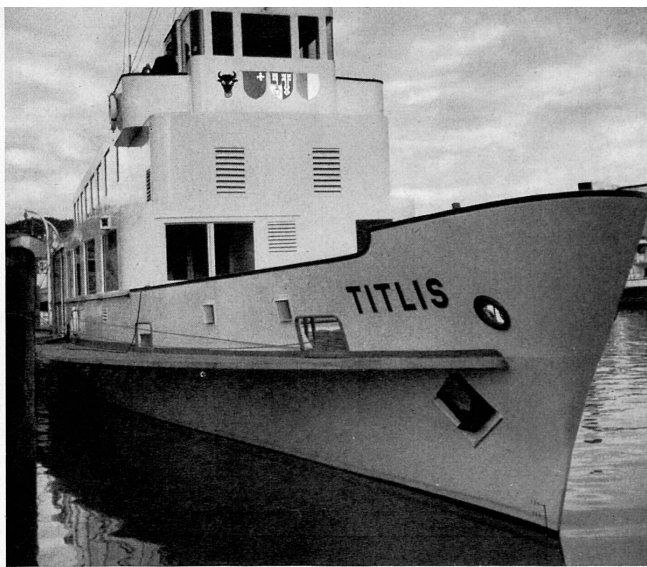
Links: Das Äußere und der gefällige Zweitklass-Restaurationsraum des neuen Motorschiffes «Titlis» der Vierwaldstättersee-Flottille.