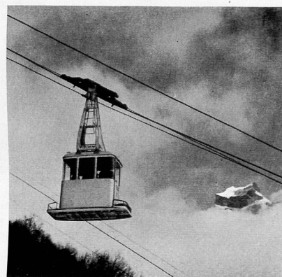
↑ Oben: Die beiden je 12 Passagiere fassenden Kabinen überwinden die 582 m Höhendifferenz in 5 Min. 20 Sek.

Der große Kurort am Fuß des Titlis hat gegen das Ende des Winters zu seinen bisherigen Sportbahnen und -lifts nach der Gerschnialp, dem Trübsee und dem Jochpaß eine weitere erhalten, die das prächtige Gelände auf der Sonnseite des Tales, der mächtvollen Gebirgsgruppe der Spannörter, des Titlis und der Wendensstöcke direkt gegenüber, erschließt. Vom Dorfkern aus tragen die beiden je 12 Passagiere fassenden Kabinen Ski-fahrer wie Bergwanderer in 5½ Minuten hinauf zur 1600 m hoch gelegenen Alperrasse von Ristis, von wo aus im Winter mehrere, zum Teil bis in den April schneesichere Abfahrts-pisten zu Tal führen, während in der nun beginnenden warmen