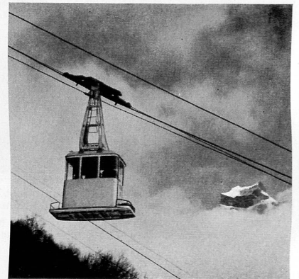
↑ Oben: Die beiden je 12 Passagiere fassenden Kabinen überwinden die 582 m Höhendifferenz in 5 Min. 20 Sek.

Der große Kurort am Fuß des Titlis hat gegen das Ende des Winters zu seinen bisherigen Sportbahnen und -lifts nach der Gerschnialp, dem Trübsee und dem Jochpaß eine weitere erhalten, die das prächtige Gelände auf der Sonnseite des Tales, der mächtvollen Gebirgsgruppe der Spannörter, des Titlis und der Wendestöcke direkt gegenüber, erschließt. Vom Dorfkern aus tragen die beiden je 12 Passagiere fassenden Kabinen Ski-fahrer wie Bergwanderer in 5½ Minuten hinauf zur 1600 m hoch gelegenen Alpterrasse von Ristis, von wo aus im Winter mehrere, zum Teil bis in den April schneesichere Abfahrts-pisten zu Tal führen, während in der nun beginnenden warmen