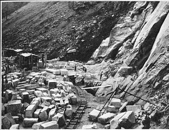
Ansicht einer Arbeitsterrasse in den Marmorbrüchen der Cristallina AG. in Peccia im Valle Maggia (TI)