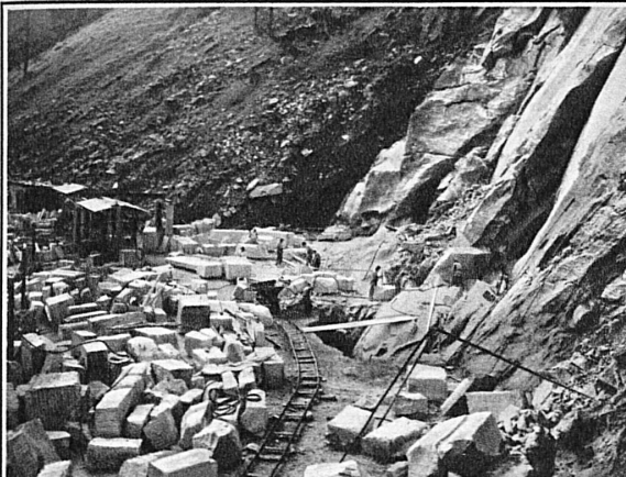
Ansicht einer Arbeitsterrasse in den Marmorbrüchen der Cristallina AG. in Peccia im Valle Maggia (TI)