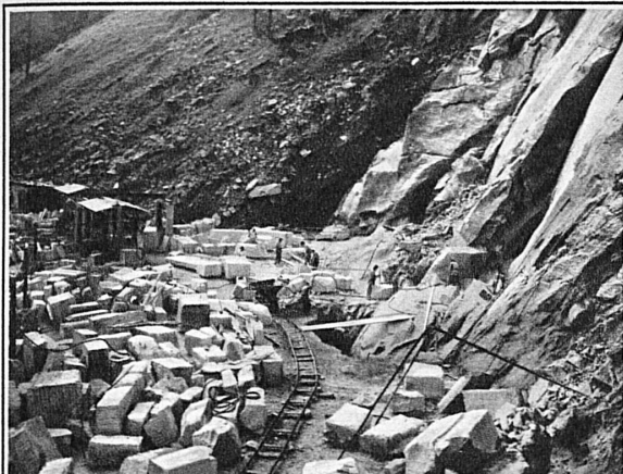
Ansicht einer Arbeitsterrasse in den Marmorbrüchen der Cristallina AG. in Peccia im Valle Maggia (TI)