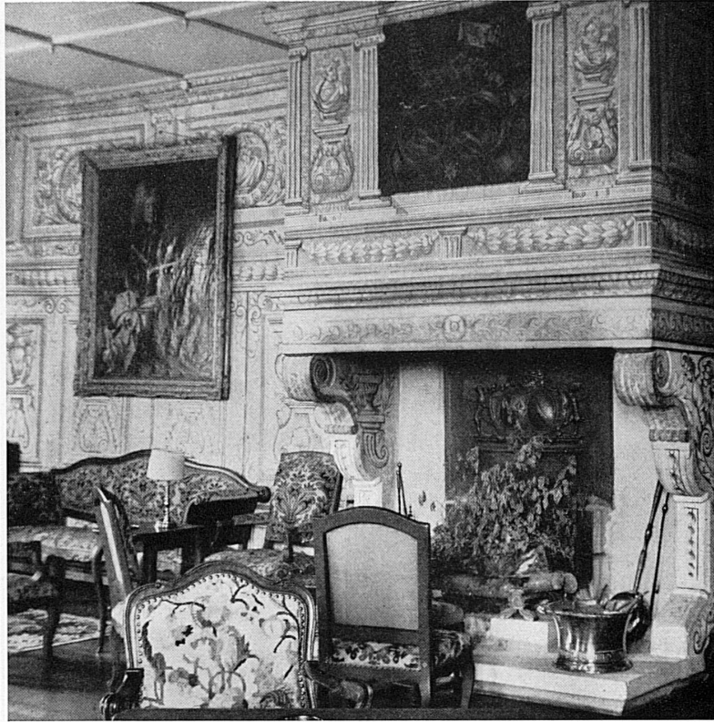
Ci-dessus: Une cheminée d'apparat dans le château de Cressier près Morat (propriété privée non accessible au public). Résidence de la famille fribourgeoise des de Reynold, Cressier a conservé tout son cachet du XVII e siècle; sur la hotte, à gauche, les armes des de Diesbach.