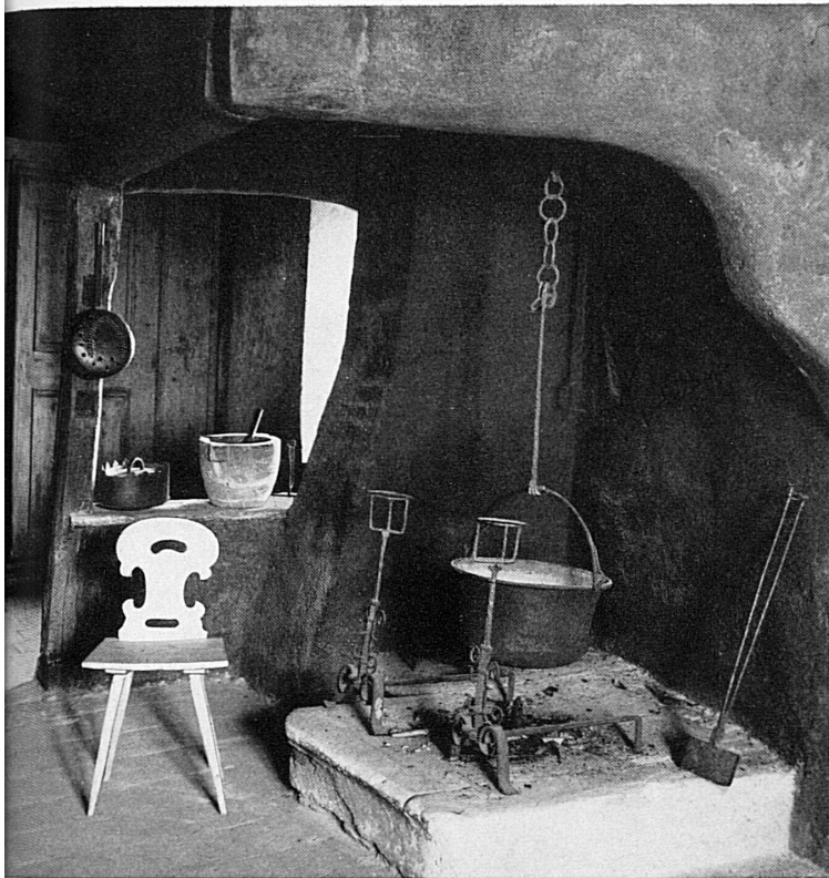
Ci-dessus: La cuisine du château médiéval de Spiez, sur le lac de Thoun. Riche en traditions pour tout ce qui touche à l'habitation, ce pittoresque poste avancé de l'Oberland bernois est un des buts d'excursion les plus populaires de Suisse.