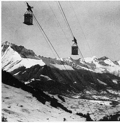
Oben: Luftseilbahn nach der Engstligenalp. Ci-dessus: Le téléphérique d'Engstligenalp.