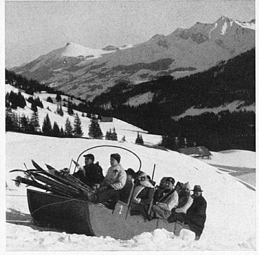
Oben: Der Funiski nach dem Hahnenmoos. Ci-dessus: Le funi-ski de Hahnenmoos.

irgendwo in der Schweiz ein nationales Skifest. Dies hatte zur Folge, daß Wettkämpfer, die mehrere Disziplinen mitzumachen gedachten – also gute All-round-Kämpfer, wie wir sie wünschen –, immer wieder in einen andern Landesteil zu reisen und dort eine Konkurrenz zu bestreiten hatten. Diesmal nun brauchen sie nur einmal, nämlich an die Schweizerische Skimeisterschaftswoche nach Adelboden zu fahren, und dort können sie nacheinander im Kampf um alle Titel ihre Ehre einlegen. Am 4. Februar treffen sich die Skikameraden und zweifellos eine Schar von Zuschauern im großen Berner Oberländer Sportplatz; die meisten von ihnen bleiben für eine ganze Woche dort. Man wird eine Reihe flottester Wettkämpfe und gleichzeitig ein echtes, langes Skifest erleben.