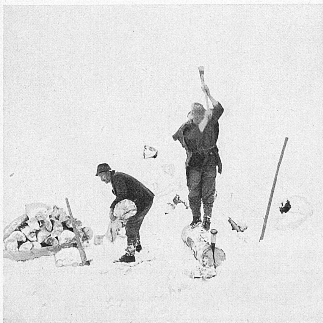
← A gauche: Cette saison est aussi celle des bûcherons. Ouvriers forestiers à Trub dans l'Emmental (Berne).

Les skieurs expérimentés ont déjà traité leurs lattes avant que de les ranger, mais d'autres ne s'y prennent que maintenant.