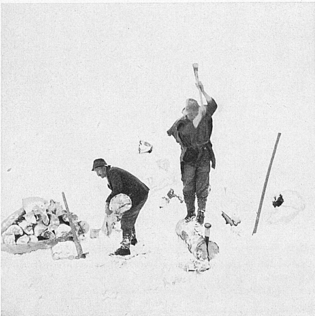
← A gauche: Cette saison est aussi celle des bûcherons. Ouvriers forestiers à Trub dans l'Emmental (Berne).

Les skieurs expérimentés ont déjà traité leurs lattes avant que de les ranger, mais d'autres ne s'y prennent que maintenant.