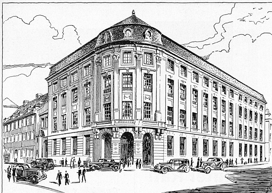
Bankgebäude in Basel – Hôtel de la Banque à Bâle