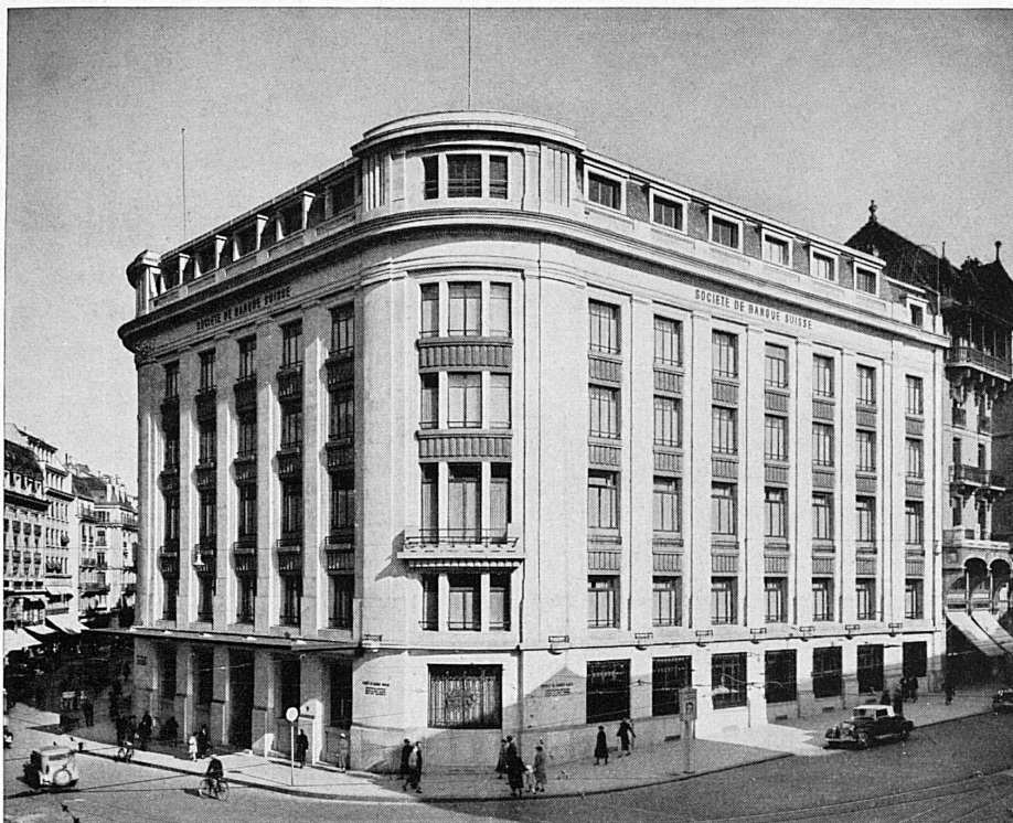
Hôtel de la banque à Genève – Bankgebäude in Genf