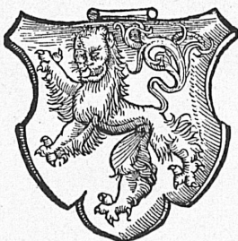
Ci-dessus: Les armes des ducs de Zähringen, telles que les représente la chronique de Stumpf. Oben: Wappen der Herzöge von Zähringen, aus der Stumpfschen Chronik.

Ce qu'on distingue tout d'abord avec le plus de netteté, depuis l'un des nombreux points de vue que permettent ces lieux escarpés, c'est le centre, appelé «Bourg», avec la Cathédrale de St-Nicolas et l'Hôtel de Ville, sur un éperon très abrupt de 230 pieds environ. On voit ensuite, sur les rochers plus hauts de l'autre rive, une partie des remparts, flanqués de hautes tours et bordés de fossés creusés dans la pierre. Ces remparts ont été construits entre 1253 et 1383 de façon très ingénieuse: ils ne sont pas continus, mais ferment seulement les passages, d'une paroi de rocher à l'autre. Partout ailleurs, ces parois assuraient elles-mêmes une défense naturelle, encore plus efficace. On trouve encore d'autres remparts à l'ouest, et des tours isolées un peu partout. C'est le plus vaste ensemble de fortifications médiévales qu'on connaisse en Suisse, et aussi le mieux conservé. La cathédrale gothique a été construite de 1283 à 1440. Elle possède une tour de 250 pieds, commencée en 1470 et terminée en 1490, avec une rose d'une finesse extraordinaire et de nombreuses dentelles de pierre taillée. Pour