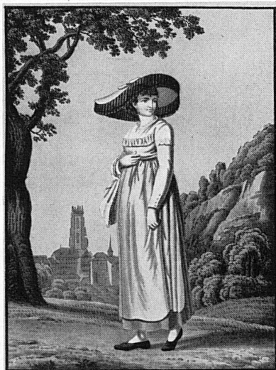
Ci-dessus: Le costume fribourgeois au début du 19 e siècle. Oben: Fryburger Tracht aus dem Beginn des 19. Jahrhunderts.

A droite: Coin tranquille de la basse-ville de Fribourg. Rechts: Stiller Winkel in der Fryburger Unterstadt.