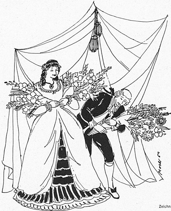
Zeichnungen von R. E. Moser