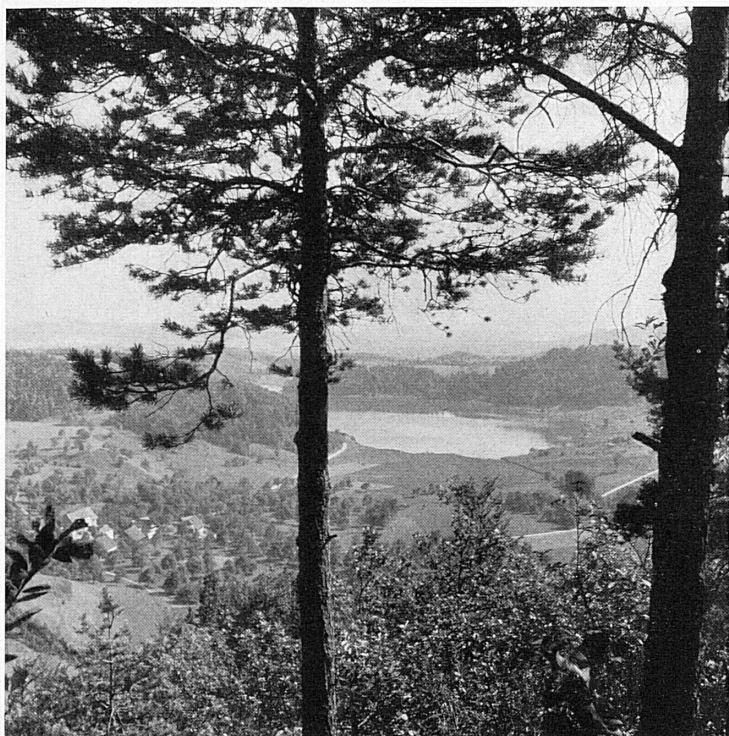
Abend am Zugersee – Lac de Zoug