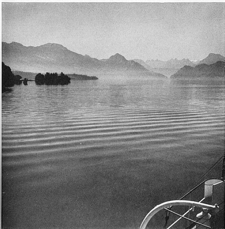
Die Weite des Vierwaldstättersees – Lac des Quatre-Cantons