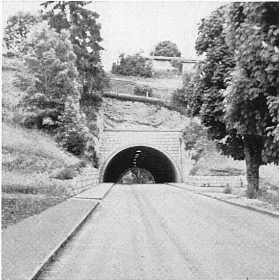
Straßentunnel in Les Brenets