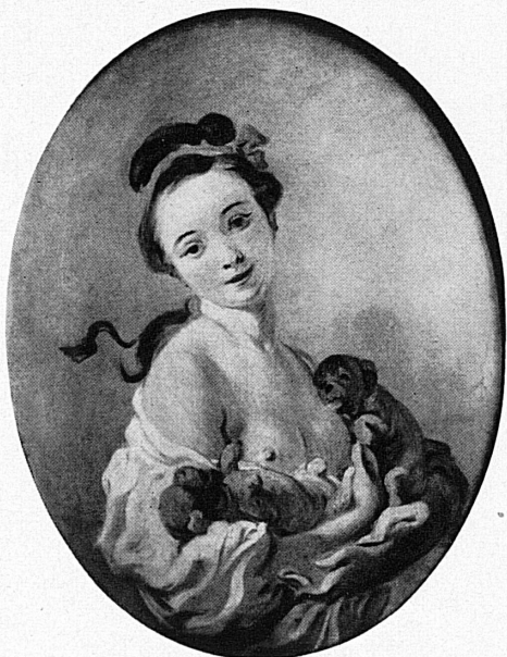
A droite – rechts: Fragonard: La jeune fille aux chiens. – Collection privée, France.