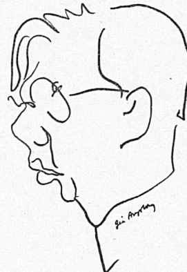
Ingemar Wizelius (Suède)