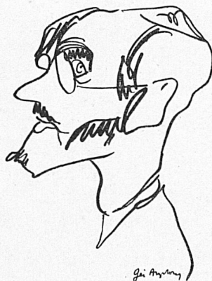
Hermon Ould (Angleterre)