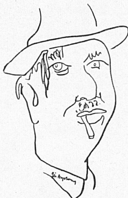
Max Deauville (Belgique)