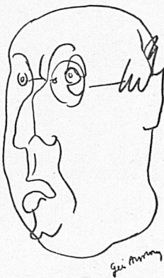
Marc Connolly (Etats-Unis)