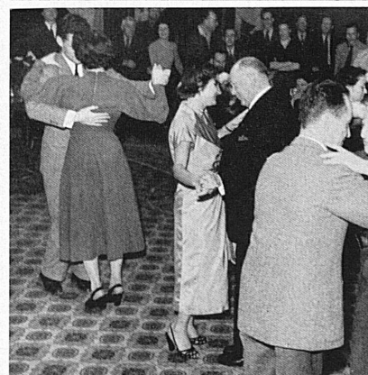
Ci-dessus: Après-ski. Les heures d'entraînement intensif se résolvent en joyeuse détente. Oben: Après-Ski! Die Stunden harten Trainings und eifrigen Skischulbetriebs münden in fröhliche abendliche Unterhaltung.

A gauche: Terminus du chemin de fer Villars-Bretaye au col de Bretaye. De là, une funiluge grimpe encore jusqu'au Chamossaire (2100 m.). Links: An der Bahn-Endstation auf dem Col de Bretaye bei Villars. Von hier führt einen der Funi-Schlitten noch höher auf den Chamossaire (2100 m.).