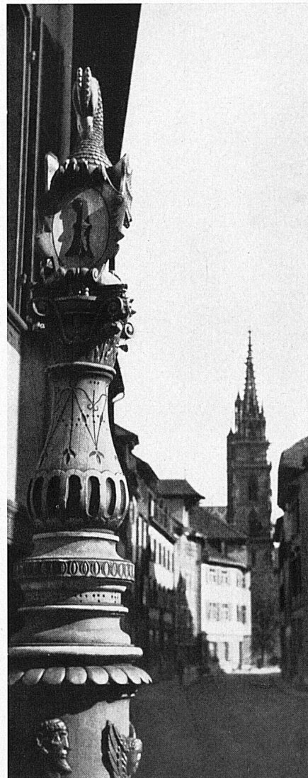
Oben: Brunnen in der Augustinergasse von Basel mit Blick gegen das Münster. Ci-dessus: Fontaine de la rue des Augustins, à Bâle, et vue sur la cathédrale.

Am 13. Juli 1951 jährt sich zum 450. Male ein Ende und ein Anfang. Die Geschichte der Stadt Basel erlebte zu Beginn des 16. Jahrhunderts das Ende einer langen, vielbewegten Entwicklung voller Fährnisse und Höhepunkte und zugleich den Beginn einer Epoche der Stabilität und der Blüte. Bedenkt man, was es heißt, daß eine nach heutigen Begriffen sehr kleine