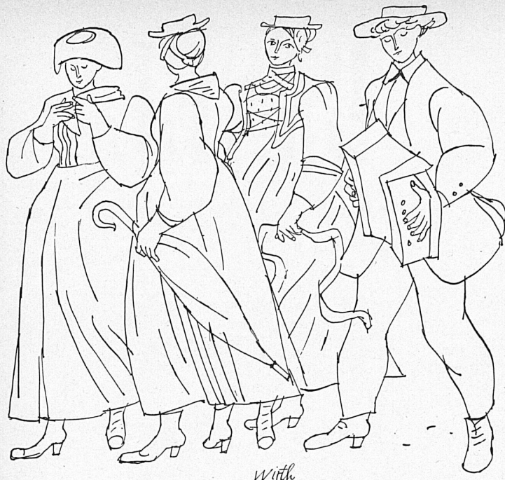
A gauche: Groupe valaisan en costumes Links: Walliser Trachtengruppe