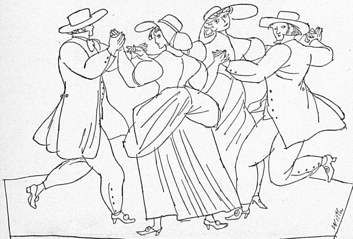
A gauche: Groupe genevois en costumes Links: Genfer Trachtengruppe