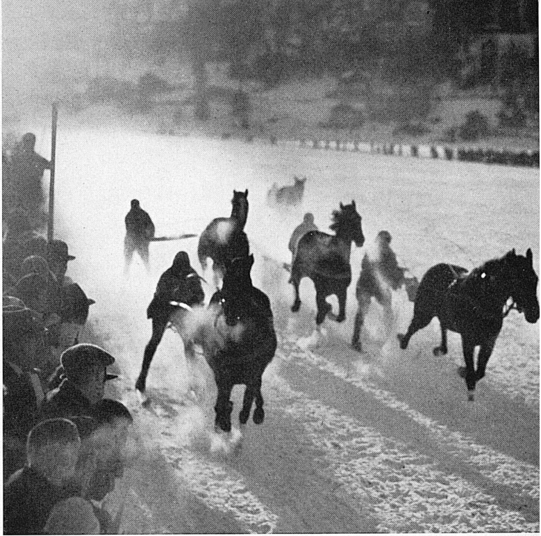
In alto: Anche lo skjöring fa parte del programma tradizionale dell'importante riunione di St. Moritz. Oben: Auch Skikjöring gehört zum traditionellen Programm des bedeutenden St.-Moritzer Anlasses. Ci-dessus: Le ski-kjöring occupe une place traditionnelle dans le programme de la grande manifestation hippique de St-Moritz.