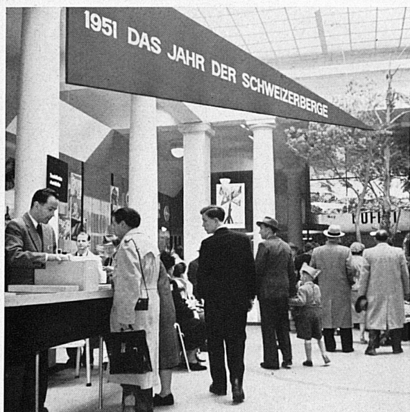
Oben: Blick in die Säulenhalle der Mustermesse in Basel, die auch dieses Jahr der Schweizer Verkehrswerbung dienstbar gemacht war. An den Längswänden des geschmackvoll eingerichteten Standes wiesen folkloristische Gegenstände und prächtige Photos auf die Reize der touristischen Regionen hin.

Der Schweizer Tourismus an der Mustermesse Basel: Le tourisme suisse à la Foire de Bâle: