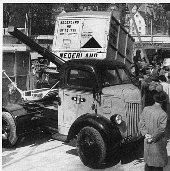
Links: Im Zusammenhang mit einem von zahlreichen Fachleuten besuchten Kongress fand im April in Zürich eine Internationale Container-Ausstellung statt, die großem Interesse begegnete. Unsere Aufnahmen zeigen links außen Rollfässer, die zusammen mit verschiedenen Arten von Klein- und Spezialbehältern zu sehen waren, sowie nebenstehend einen Behälter der Niederländischen Staatsbahnen beim Aufladen auf einen Sattelschlepper-Camion.