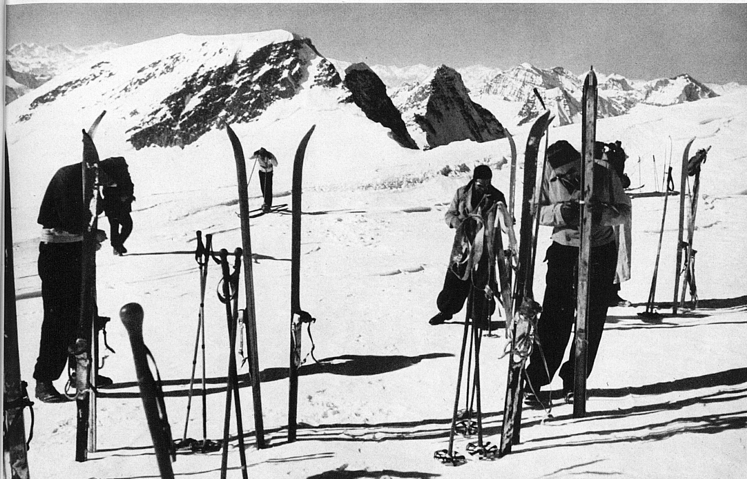
Oben: Auf die Ebnefluh führt eine lohnende Frühlingskittour vom Jungfraujoch aus. Blick gegen Breithorn-Balmhorn. Ci-dessous: Un excellent itinéraire de randonnée à ski mène du Jungfraujoch à l'Ebnefluh. Vue sur le Breithorn-Balmhorn.