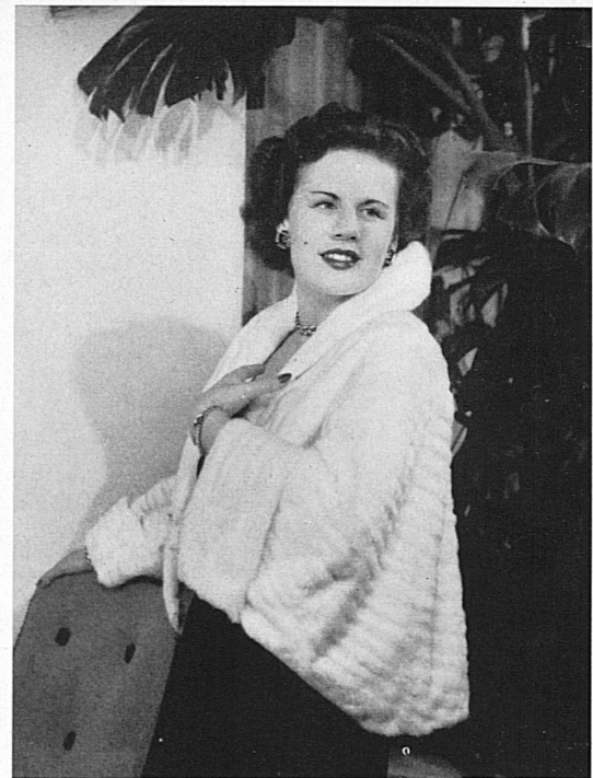
Oben: Cape-Bolero für den Abend aus naturweißen russischen Hermelfellen. – Ci-dessus: Boléro-cape pour le soir en hermine russe naturelle.