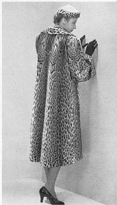
Oben: Eleganter, lose fallender Ozelot-Mantel. – Ci-dessus: Élégant manteau vague d'ocelot.