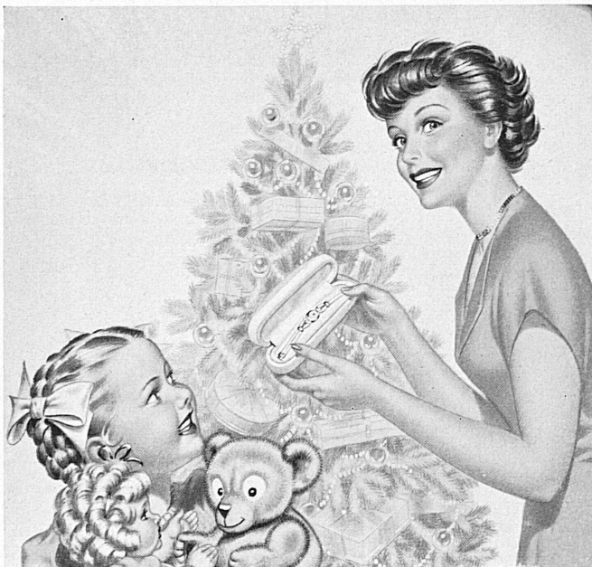
L'arbre de Noël joie d'un soir, Doxa joie d'une vie