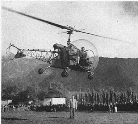
Oben: Ein Helikopter überbrachte anlässlich der Chavez-Gedenkfeier eine Botschaft des Stadtpräsidenten von Brig an den Sindaco von Domodossola. – Ci-dessus: A l'occasion de la fête commémorative du premier vol de Chavez, un hélicoptère a apporté au syndic de Domodossola un message du président de la commune de Brigue.