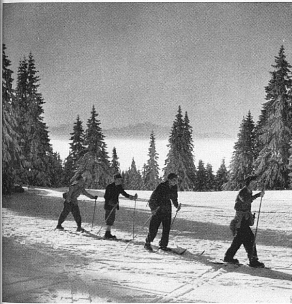
Ci-dessus: Randonnée à skis près de La Casba dans le Jura vaudois. Derrière les sapins couverts de neige, on aperçoit le Mont-Blanc. – Oben: Skiwanderung bei «La Casba» im Waadtländer Jura. Über verschneite Tannenzipfel hinweg grüßt der Mont-Blanc.

Ci-dessous: Skieurs au Chasseron au-dessus de Ste-Croix; à l'arrière-plan la chaîne des Alpes bernoises et fribourgeoises; au premier plan, à gauche, on devine le lac de Neuchâtel. – Unten: Skiläufer am Chasseron ob Ste-Croix. Im Bildhintergrund die Kette der Berner und Freiburger Alpen. Vorne links der Neuenburgersee.