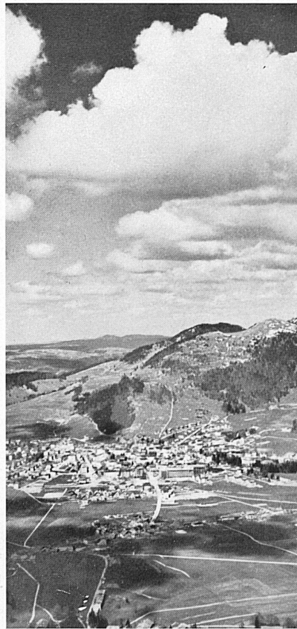
Ci-dessus: Vue de Ste-Croix, centre artisanal et industriel du Jura vaudois; à l'arrière-plan, les contreforts du Chasseron. – Oben: Blick auf das gewerbe- und industriereiche Dorf Ste-Croix im Waadtländer Jura; dahinter der Aufstieg zum Chasseron.