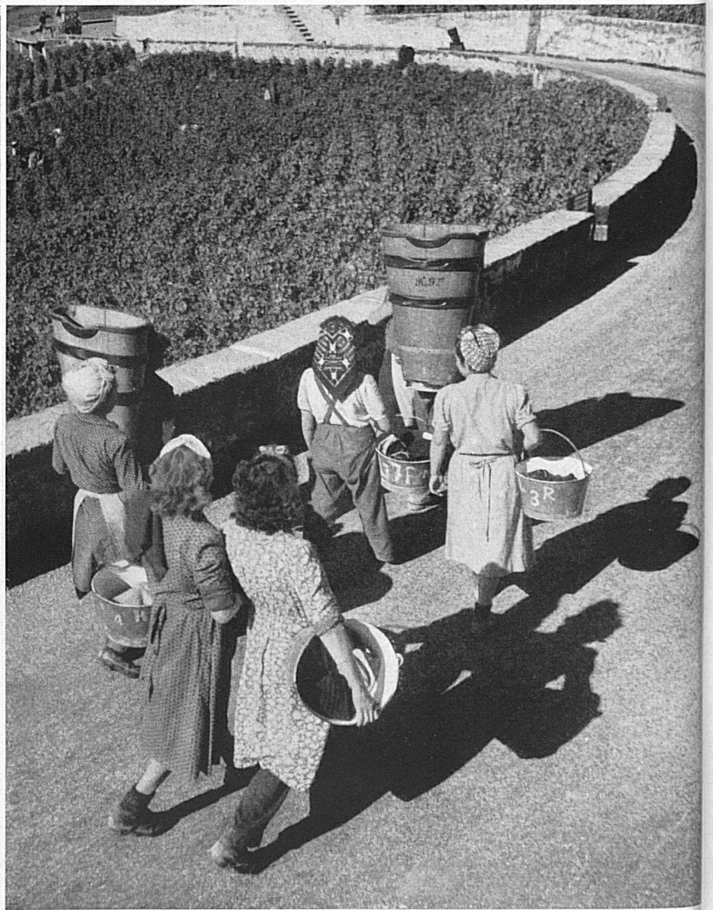
Oben: Auf zum Wimmel! – En route pour la vendange.

Rechts: In einer der traulichen waadtländischen Kleinstädte. – A droite: Dans une aimable petite ville vaudoise.