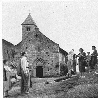
Ci-dessus: En montant à l'église de Valère, à Sion. — Oben: Beim Aufstieg zur Burgkirche Valeria in Sion.