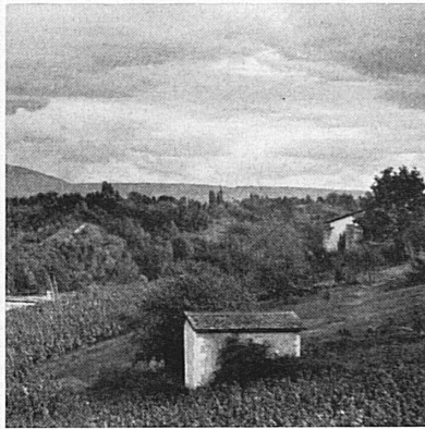
Ein weiter Horizont bietet sich einem von landschaftlicher Schönheit trunkenen Auge im Genfer Rebland unterhalb der Calvin-Stadt. – Un horizon plus vaste encadre les vignobles genevois.

Rechts: Aus einem Winzerfest-Umzug in Morges am Genfersee. – A droite: Charmant sujet aperçu au cortège des vendanges de Morges.