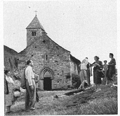
Ci-dessus: En montant à l'église de Valère, à Sion. — Oben: Beim Aufstieg zur Burgkirche Valeria in Sion.