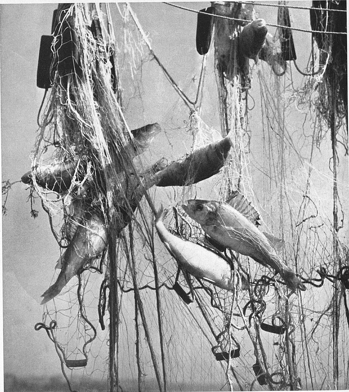
A droite: Fruits d'eau douce. — Rechts: Zapplige Beute.