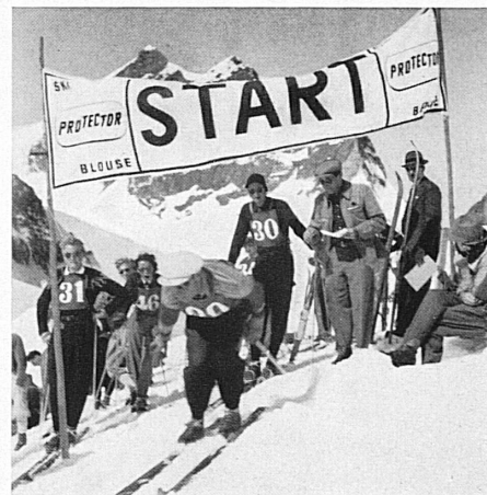
Beim Start zum Jungfrau-Skirennen oben auf dem Joch. Im Hintergrund der Jungfraugipfel. — Départ, au col de la Jungfrau, des courses de ski du même nom. A l'arrière-plan, le sommet de la Jungfrau.