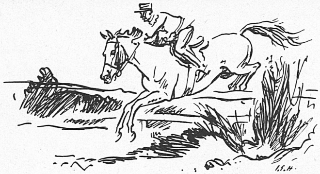
Zeichnung von Iwan G. Hugentobler.

Thun: der Concours hippique mit Dressurprüfungen. Es ist eine der größten rein schweizerischen Vorführungen. Nachdem jetzt die Auflösung der Eidgenössischen Pferderegieanstalt in Thun vollzogen wird, mußte sich das traditionelle Thuner Reiterfest nach einem neuen Platz umsehen. Und so wird der 31. Nationale Concours hippique in Thun am 24. und 25. Juni zum erstenmal auf dem Areal stattfinden, wo im letzten Sommer die Kaba aufgestellt war. Vom Aarestrand ist man also an den untern Thunersee umgezogen, aber der reizvolle Flecken mit der herrlichen Rundschau auf die Alpen wird einen würdigen Rahmen bilden.