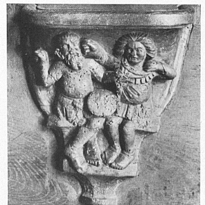
Oben: Geschnittene Misericordien (Sitzknäufel) vom Chorgestühl im Münster. — Ci-dessus: Stalles de la cathédrale: misericordes sculptées.

Wie Schaffhausen hat auch die Stadt Basel wertvolle Teile ihrer historischen Sammlungen in den schönen und sehr glücklich restaurierten Gebäulichkeiten eines ehemaligen Klosters untergebracht. Das «Kleine Klingental» am Ufer des Rheins in Kleinbasel enttäuscht mit all dem, was es bietet, den Besucher nicht. Seine geräumigen Säle enthalten die großartigen Original-Plastiken vom Münster, deren am ursprünglichen Ort heute angebrachte Kopien sich vielfach in Höhen befinden, die dem Blick das Detail entziehen. Dazu vermittelt das Museum mit zahlreichen Ansichten, Plänen und Modellen eine überaus interessante Vorstellung von der Altstadt und ihrer Entwicklung.