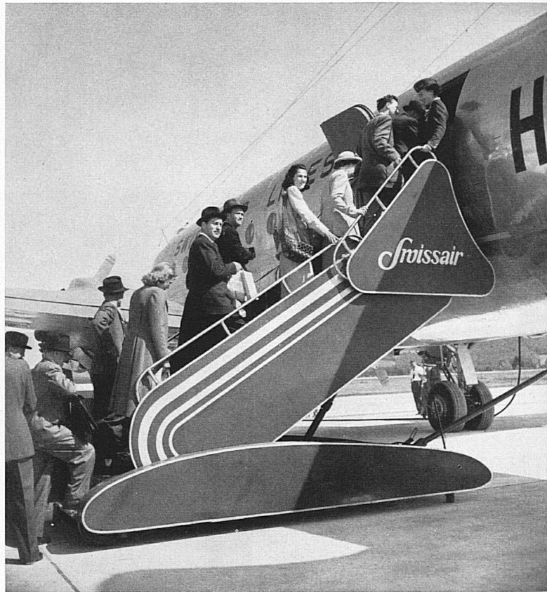
Oben: Vor dem Abflug. — Ci-dessus: Avant le départ.