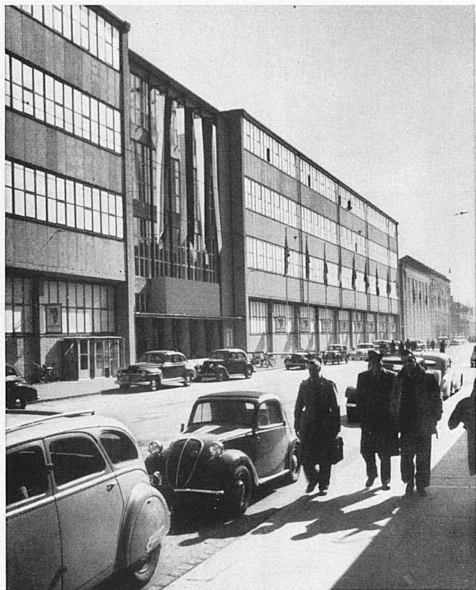
Oben: Die 1948 fertiggestellte neueste Hallenfront der Muba. — Ci-dessus: Façade, terminée en 1948, des nouvelles halles de la Foire suisse de Bâle.