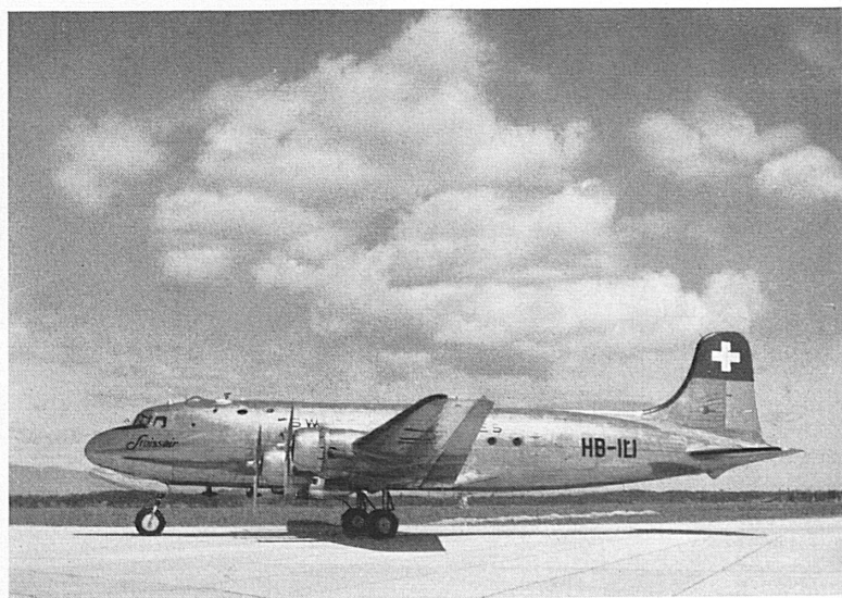
Oben: Die leistungsfähige und ausgezeichnet unterhaltene Transatlantik-Maschine der Swissair, die DC 4. — Ci-dessus: Un DC 4, puissant quadrimoteur que la Swissair utilise pour ses services transatlantiques.

Les principales agences de voyage sont en mesure de donner des renseignements.