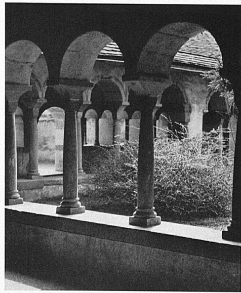
Der Kreuzgang des Klosters Allerheiligen zu Schaffhausen. — Le cloître du couvent de Tous-les-Saints à Schaffhouse.