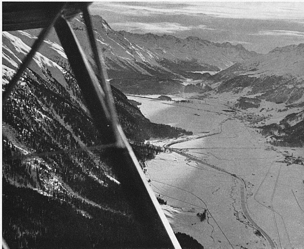
Oben: Blick auf den Talboden des Oberengadins bei Bever-Samedan. In der Bildmitte der Hangar des Oberengadiner Flugplatzes. Im Hintergrund die Gegend von St. Moritz und die Bergeller Berge. — In alto: Veduta del fondovalle dell'Alta Engadina presso Bever-Samedan. Nel centro la rimessa dell'aerostadio dell'Alta Engadina. Nel fondo i dintorni di St. Moritz e i monti della Bregaglia.

Die Aufnahmen dieser beiden Seiten stammen zu einem guten Teil von einem Flug, der letzten Winter anlässlich der Olympischen Spiele in St. Moritz unternommen wurde. Gewiß, die allerwenigsten der vielen Gäste des Bündnerlandes reisen durch die Luft ans Ziel ihrer Wünsche; zumal da auch gar keine regelmäßige Flugverbindung zwischen dem Unterland und etwa dem Engadin besteht, vertrauen sie sich den bequemen und auf ihre Art flinken Wagen der Rhätischen Bahn an und kennen dann die durchfahrene Landschaft eben aus der Bodenperspektive. Den-