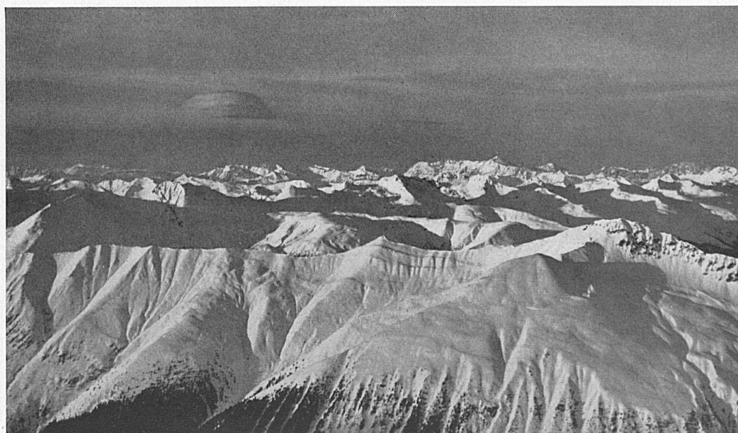
Unten: Die Mittelbündner Gebirgswelt zwischen Bergün, Davos u. Arosa. Die hohe Kette im Hintergrund ist der Rhätikon, mit der Scesaplana als Hauptgipfel. — In basso: Il gruppo centrale delle montagne grigionesi fra Bergün, Davos e Arosa.