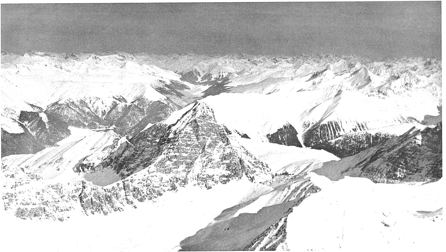
Oben: Das Wahrzeichen der Davoser Landschaft, das markante Tinzenhorn, von der Rückseite, mit Blick in den Davoser Talboden und gegen das Parsenngebiet links davon. — In alto: Il Tinzenhorn visto da tergo e colpo d'occhio sul fondovalle di Davos.