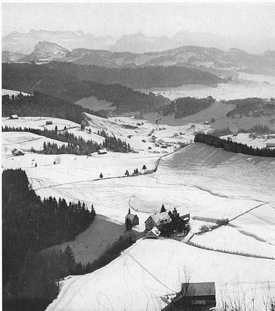
Links: Einsiedler Bergland im Winter. Im Vordergrund die Etzel-Paßhöhe. In Einsiedeln findet am 6., evtl. 13. Februar der 2. Turnerskitag des ETV statt. A gauche: Vue sur la région d'Einsiedeln.