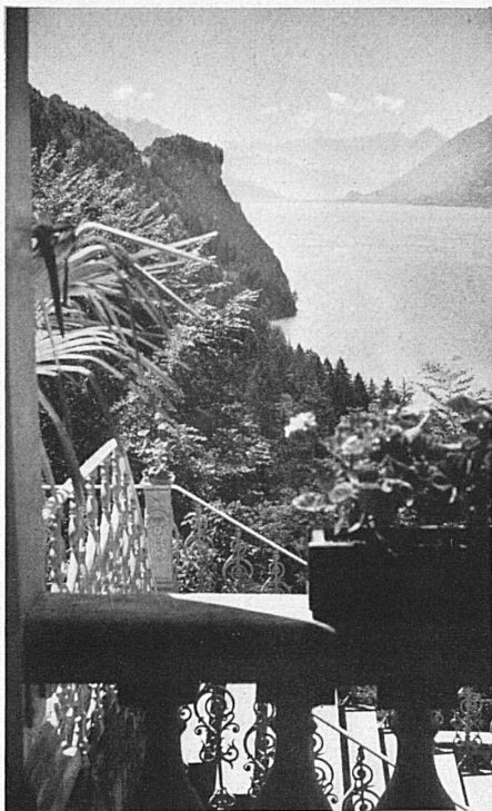
Oben: Blick vom Hotel Giessbach auf den Brienzersee, zu welchem steile Waldufer abbrechen. — En haut: Vue de l'hôtel Giessbach sur le lac de Brienz.

stock-Hotels gesammelt hatte, war es ihm möglich, das käuflich erworbene Giessbach-Besitztum in einer Weise auszugestalten, daß es als beliebter Aufenthaltsort heute wieder einen ersten Platz beanspruchen darf. Mit seiner Tatkraft hat er dem Berner Oberland große Dienste erwiesen. S.