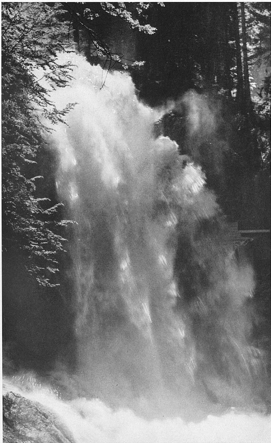
Einer der imposantesten Fälle der insgesamt 14 Wasserstürze, welche der Gießbach vor seiner Mündung in den Brienersee in großartiger Waldlandschaft beschreibt. — L'une des plus imposantes des 14 cascades du Giessbach qui se jette dans le lac de Brienz.

werk erwog, was das Geschick des Ortes und des Naturschauspiels völlig besiegelt hätte. Einsichtige Kreise setzten sich zur Wehr, und es gelang ihnen, in Herrn F. Frey-Fürst einen Mitstreiter zu gewinnen, der recht eigentlich zum Retter des Unternehmens und der Fälle wurde. Dank seinen Fachkenntnissen und den vielseitigen Erfahrungen, die er als Erneuerer der Bürgen-