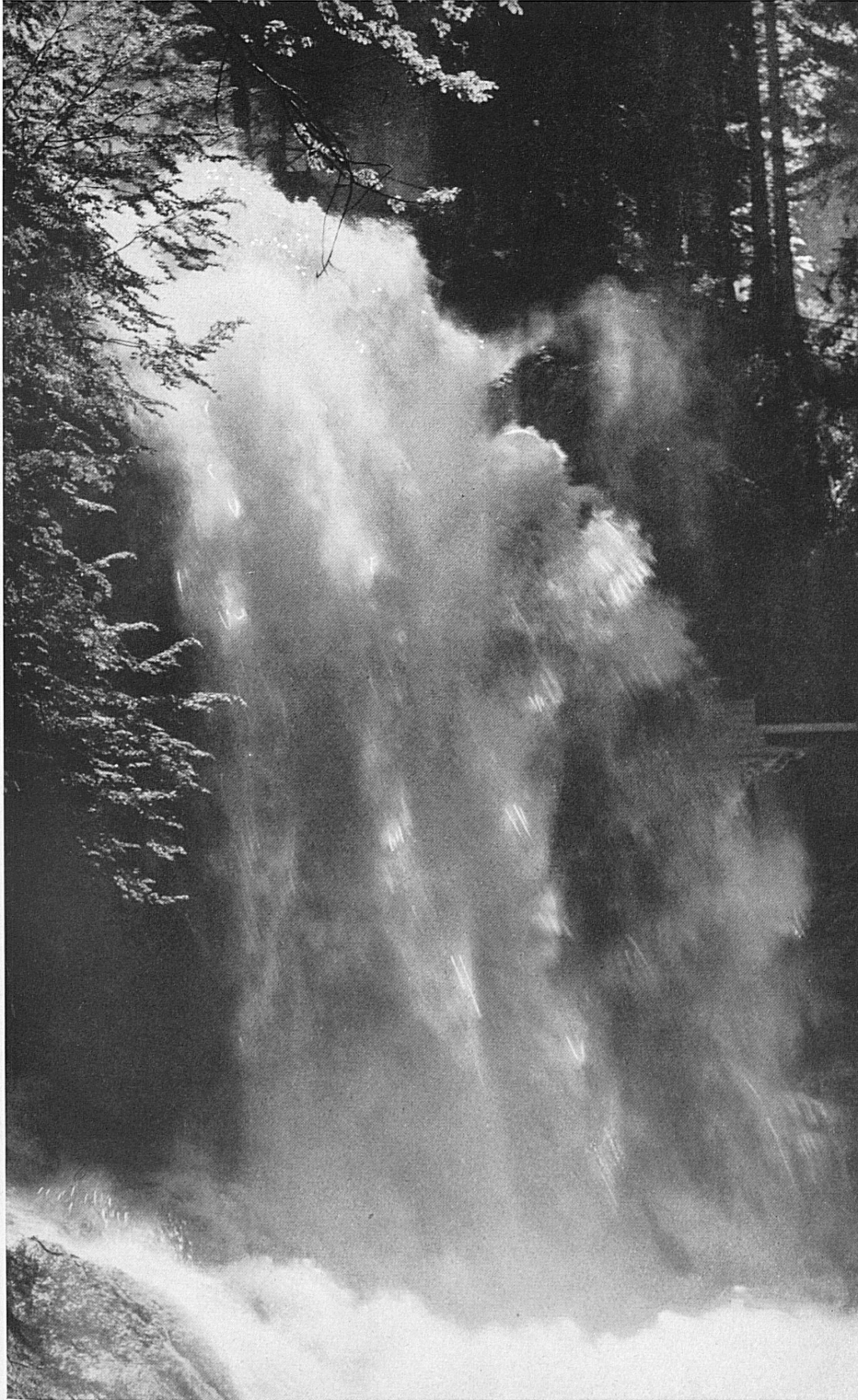
Einer der imposantesten Fälle der insgesamt 14 Wasserstürze, welche der Gießbach vor seiner Mündung in den Brienersee in großartiger Waldlandschaft beschreibt. — L'une des plus imposantes des 14 cascades du Giessbach qui se jette dans le lac de Brienz.