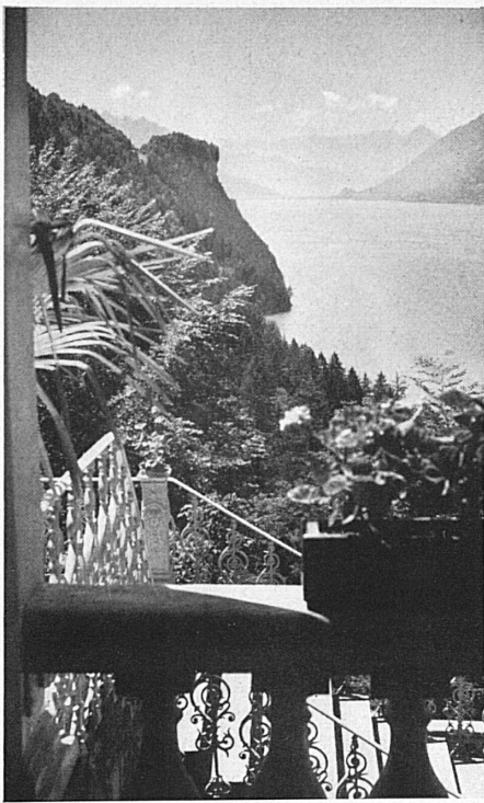
Oben: Blick vom Hotel Giessbach auf den Brienzsee, zu welchem steile Waldufer abbrechen. — En haut: Vue de l'hôtel Giessbach sur le lac de Brienz.

stock-Hotels gesammelt hatte, war es ihm möglich, das käuflich erworbene Giessbach-Besitztum in einer Weise auszugestalten, daß es als beliebter Aufenthaltsort heute wieder einen ersten Platz beanspruchen darf. Mit seiner Tatkraft hat er dem Berner Oberland große Dienste erwiesen. S.