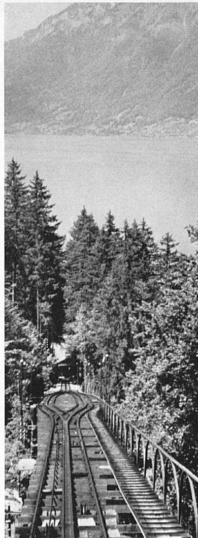
Oben: Die Gießbachbahn wurde 1879 dem Betrieb übergeben. Zur Neueröffnung vor Jahresfrist ist sie vollkommen auf elektrischen Betrieb umgestellt worden. — En haut: C'est en 1879 que le funiculaire électrique du Giessbach fut mis en exploitation.