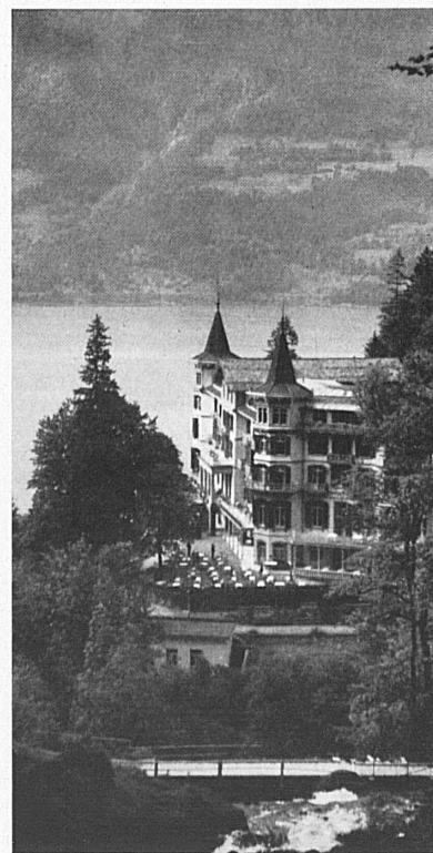
Unten: Das Parkhotel Gießbach wurde nach umfassender Renovation und Modernisierung — alle Einrichtungen sind elektrisch — diesen Sommer wieder eröffnet. — En bas: L'hôtel du Parc au Giessbach a été rouvert cette année, entièrement rénové et modernisé.