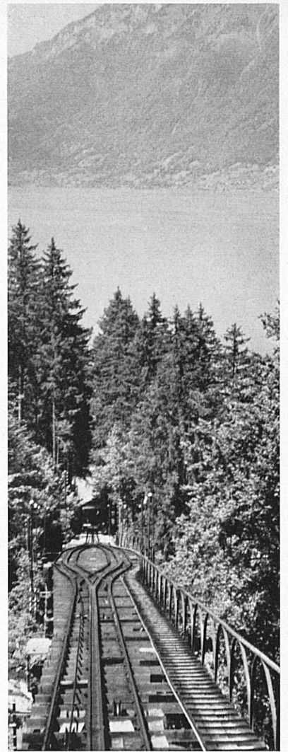
Oben: Die Gießbachbahn wurde 1879 dem Betrieb übergeben. Zur Neueröffnung vor Jahresfrist ist sie vollkommen auf elektrischen Betrieb umgestellt worden. — En haut: C'est en 1879 que le funiculaire électrique du Giessbach fut mis en exploitation.