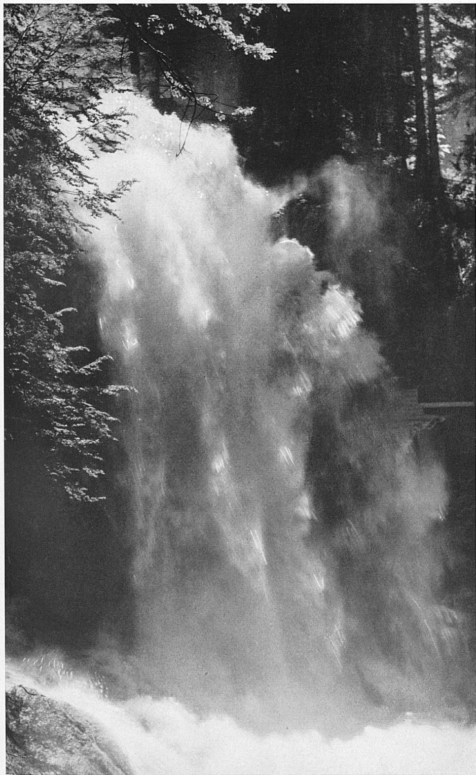
Einer der imposantesten Fälle der insgesamt 14 Wasserstürze, welche der Gießbach vor seiner Mündung in den Brienersee in großartiger Waldlandschaft beschreibt. — L'une des plus imposantes des 14 cascades du Giessbach qui se jette dans le lac de Brienz.