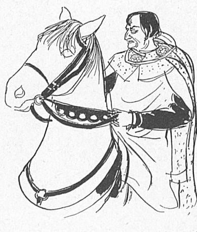
Gessler. (Tellschpiele Altdorf)

ein einziger Berufsschauspieler in den Ring; alle, die kommen und handeln, entstammen der ansässigen Bevölkerung. Und immer wieder haben sich seit dem ersten Wagnis des Freilichtspiels im Sommer 1931 Gestalten unter den Akteuren gefunden, die uns