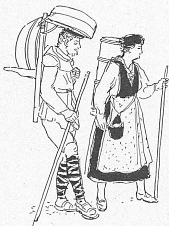
Leute aus dem Volk. — Gens du peuple. (Tellschpiele Interlaken)

Man ginge freilich fehl, wollte man glauben, daß die Mitspieler ihre Rolle im stillen Kämmerlein ausproben und dann frischfröhlich vor die Menge treten. Bereits im Januar haben die Interlakner Spieler mit den Proben für die Vorstellungen begonnen. Und