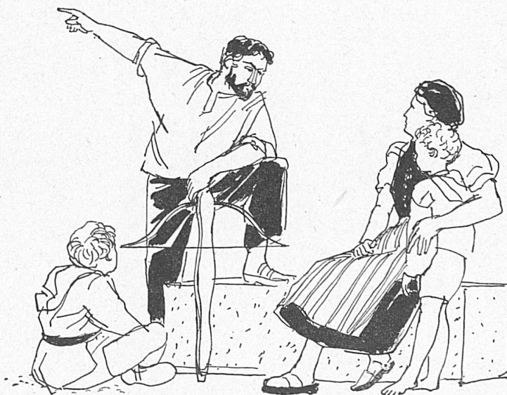
Tell mit den Seinen. — Guillaume Tell avec les siens. (Tellspiele Altdorf)

erst in gedrängten Reihen sitzen und aus dem Mund der Mannen und der Frauen die alten, längst bekannten Verse hören, so fühlen wir, wie neues Leben aus ihnen sprüht. Kaum einer der Zuschauer wäre, der sich an dem nicht ganz korrekten Theaterdeutsch stieße; im Gegenteil — der herbe, rauhe Ton der Sprache, der schwere Gang